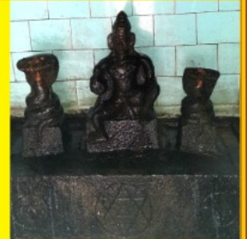
Sri Saalakarai Ayyanar