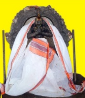
ஸ்ரீ ஆஞ்சநேய சுவாமி