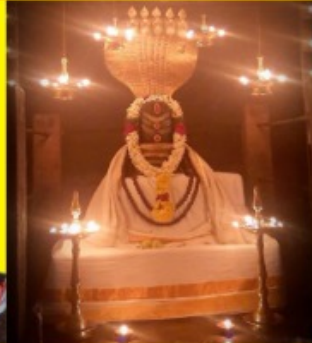
Sri Vikrama Pandeeshwarar