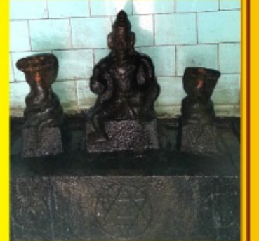
ஸ்ரீ சாலக்கரை அய்யனார்