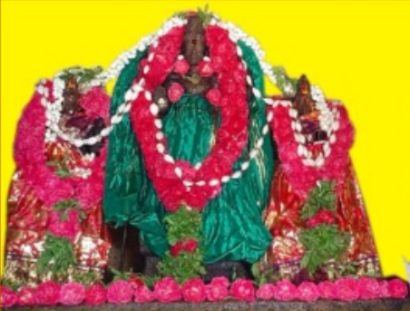
Sridevi Bhudevi Sametha Sri Varadharaja Perumal