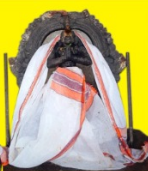
Sri Anjaneya Swamy