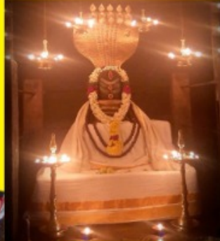
ஸ்ரீ விக்ரம பாண்டிஸ்வரர்