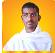
SRIVATSA - SRIRANGAM

By Sri Hari Vayu Guru's anugraha Above Our gurukula vidhyaartis had completed their veda adhyayana & they will be reciting entire veda parayana without book reference in the presence of examiners at Sri Vyasaraaja mutt, Chennai from 02.05.2023 to 07.05.2023 . In the last 12 years during our annual functions 27 students of our gurukula have thus completed the Kantasta parayana.